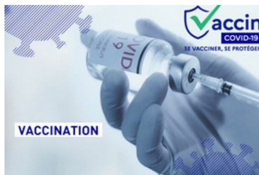
Schéma départemental de la vaccination